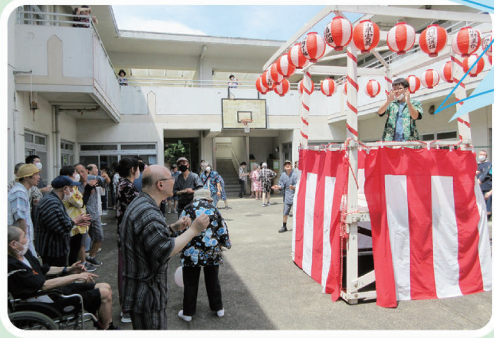
7/27 竹の子学園夏祭り