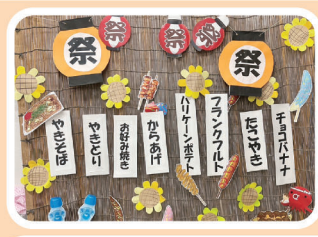
7/13 竹の子ケアセンター夏祭り