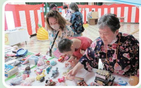
どれにしようかな～