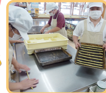
4 グリッシーニはこうやって伸ばすんだよ