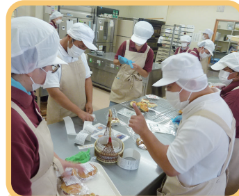
6 みんなで協力し合って袋入れ!