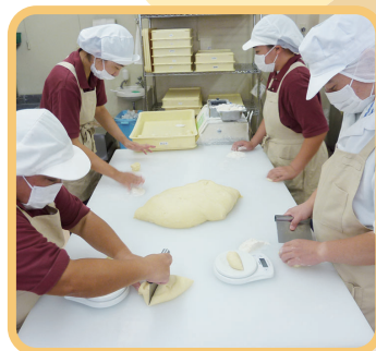
2 パン生地の分割風景