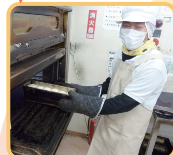
5 パンも焼き菓子も綺麗に焼くよ!