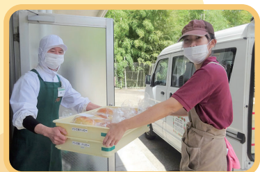
8 注文先にパンを納品