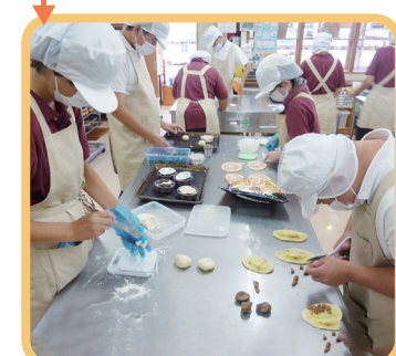
3 パンの種類は30以上!!